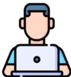
Active Human Monitoring & Intervention