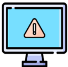
AI-Enabled Automated Proctoring

O mesmo se aplicará também se o candidato for visto a utilizar um telemóvel ou a executar qualquer outra tarefa que não esteja diretamente relacionada o teste.